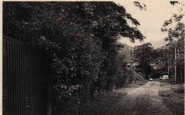
Foto 1. Zona recorrida para entrega de notificación.