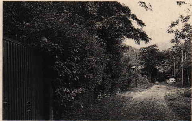
Foto 1. Zona recorrida para entrega de notificación.