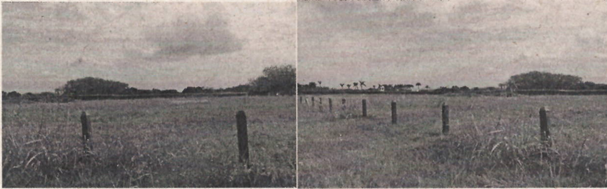
Imagen 1.2. Ubicación del lote.

Corporación Autónoma Regional del Valle del Cauca