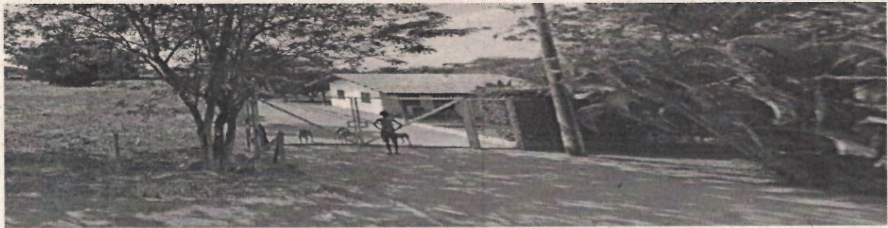
Predio vecino ubicado al lado del Lote.