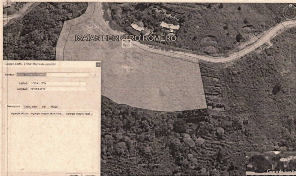
Fotografía 1: Ubicación predio, fuente: GeoCVC 2023.

Se realiza visita técnica al predio: "SN", que se ubica en inmediaciones de las coordenadas geográficas: N 3°25'41.17"O 76°34'2.19".