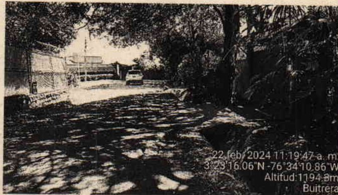
Foto 1. Zona recorrida para entrega de notificación.

Corporación Autónoma Regional del Valle del Cauca