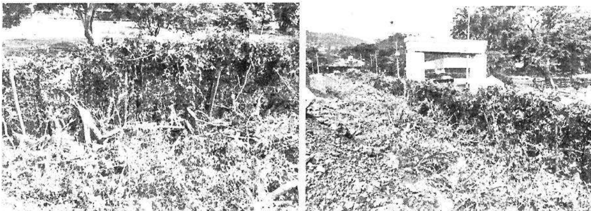
Ilustración 5 y 6 Material forestal de todo el tramo de corte de árboles de la especie Chiminango ( Pithecellobium dulce )

“POR MEDIO DE LA CUAL SE IMPONE MEDIDA PREVENTIVA DE SUSPENSIÓN DE ACTIVIDADES EN EL PREDIO SITUADO EN LA CALLE 10 CON CARRERA 29 ESQUINA, FRENTE A DAPA MALL, JURISDICCIÓN DEL MUNICIPIO DE YUMBO EN CONTRA DE LAS SOCIEDADES NATURA PROYECTOS Y CONSTRUCCIONES S.A.S, IDENTIFICADO CON NIT: 901.349.508-7, Y RISING SUN OVERSEAS S.A, Y FONDO INMOBILIARIO S.A.S. IDENTIFICADO CON NIT: 901.615.617-2”