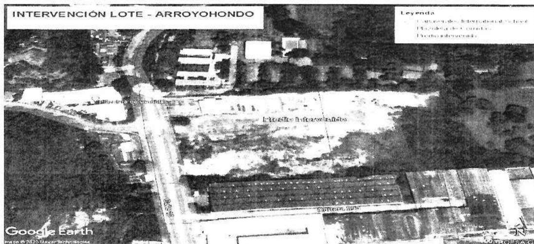
Ilustración 1 ubicación lote propiedad de la Sociedad RISING SUN OVERSEAS S.A