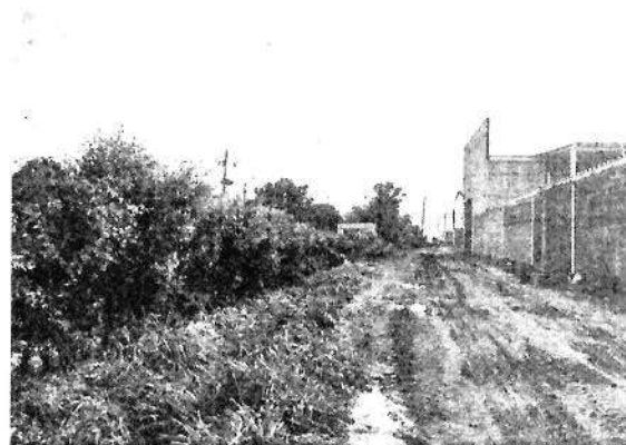
Ilustración 2 Tramo del corte de árboles de la especie Chiminango ( Pithecellobium dulce ) con vista desde el Colegio Hispano