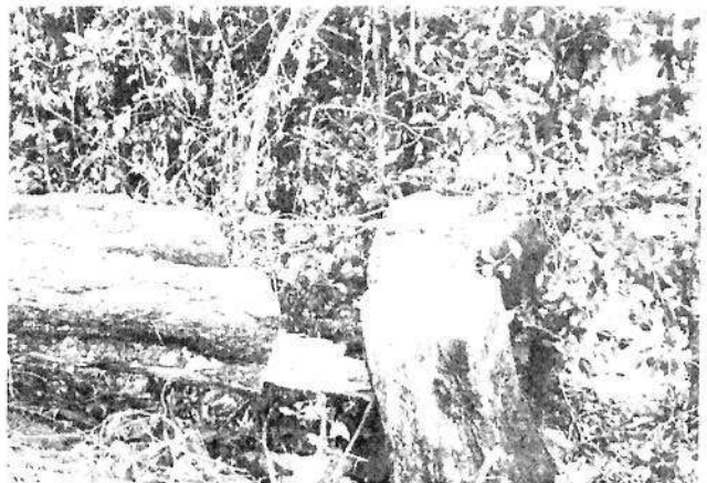
Ilustración 7-10. Tocones de los árboles cortados en el predio de la Sociedad RISING SUN OVERSEAS S.A