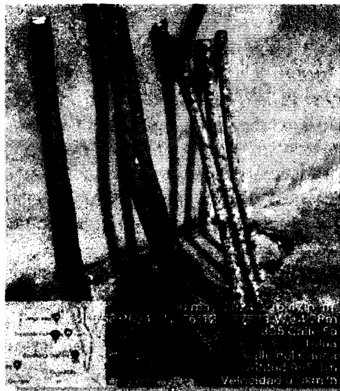
Registro fotográfico, madera de guácimo (diámetro entre 5 y 10 cm) utilizada para la elaboración de accesorios para la venta, en la vivienda Calle 6 ta N° 23-05, barrio Villa Colombia, del municipio de Tuluá.