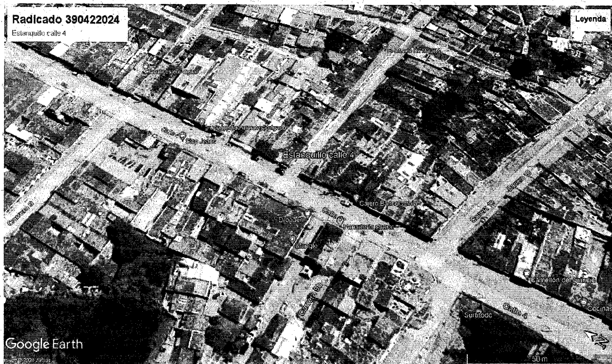
Imagen 1. Google Earth 2024

Coordenadas geográficas: 4°44'43.30"N -75°54'18.50"W