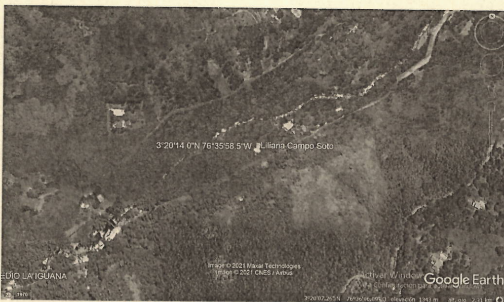
Predio el refugio, vereda la voráGINE, corregimiento Pance Coordenadas 3°20'14.0"N 76°35'58.5"W

Se realiza desplazamiento hasta el predio el refugio, con el propósito de realizar entrega de acto administrativo del 16 de febrero del 2021, en el cual se informa auto de archivo, del expediente número 0711-039-004-060-2018 en la que se visitó en diferentes fechas para entrega del documento 24 de febrero del 2021 12:03 pm, 14 de abril de 2021 11:56 am, 31 de julio de 2021 09:00 am a la señora Liliana Campo Soto en el predio el refugio, vereda la voráGINE, corregimiento de Pance, donde se efectúa la devolución del documento ya que la señora Liliana Campo Soto, se niega a recibirlo expresando que es representada por el cabildo abriendo caminos de Pance y le han indicado que no firme ningún tipo de documentos, por tal razón se realiza la devolución del documento.