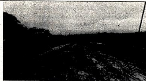
Imagen 3. Embalstrado de vía