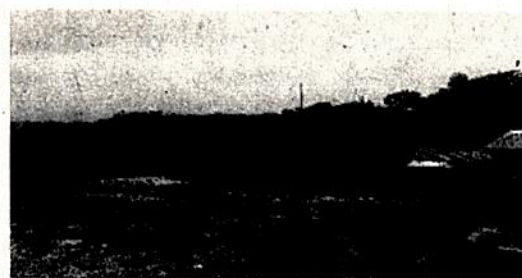
Imagen 5. Vía