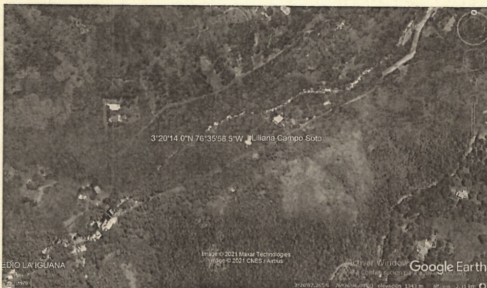
Predio el refugio, vereda la vorágine, corregimiento Pance Coordenadas 3°20'14.0"N 76°35'58.5"W

Se realiza desplazamiento hasta el predio el refugio, con el propósito de realizar entrega de acto administrativo del 16 de febrero del 2021, en el cual se informa auto de archivo, del expediente número 0711-039-004-060-2018 en la que se visitó en diferentes fechas para entrega del documento 24 de febrero del 2021 12:03 pm, 14 de abril de 2021 11:56 am, 31 de julio de 2021 09:00 am a la señora Liliana Campo Soto en el predio el refugio, vereda la vorágine, corregimiento de Pance, donde se efectúa la devolución del documento ya que la señora Liliana Campo Soto, se niega a recibirlo expresando que es representada por el cabildo abriendo caminos de Pance y le han indicado que no firme ningún tipo de documentos, por tal razón se realiza la devolución del documento.