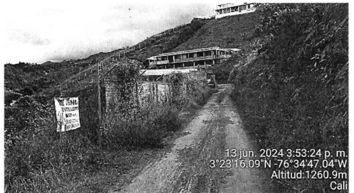
Foto 1. Zona recorrida para entrega de notificación.