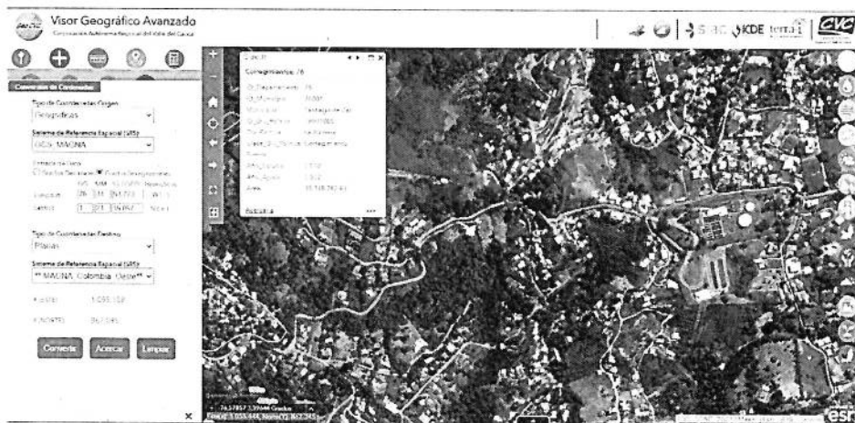
Mapa 1. Ubicación geográfica de la visita realizada.

Jurisdicción del Distrito de Cali, corregimiento de La Buitrera, Sector Callejón Anchicayá, Inmediaciones de las coordenadas geográficas 3°23'39,057" N -76°34'53,773" y Planas X=1055108 E Y=867095 N