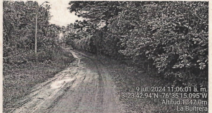
Foto 1. Zona recorrida para entrega de notificación.