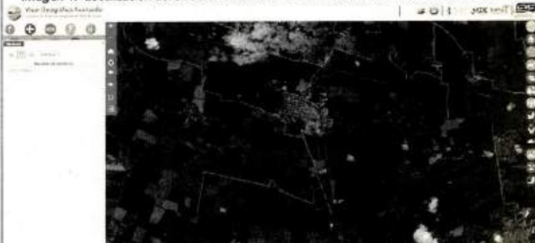
Imagen 1. Localización del sitio de obtención de carbón con coordenadas N 03°43'38"5" - W

76°19'22.5" Sector Corregimiento El Triunfo-Municipio de Guacarí, Valle del Cauca con referencia al perímetro urbano.