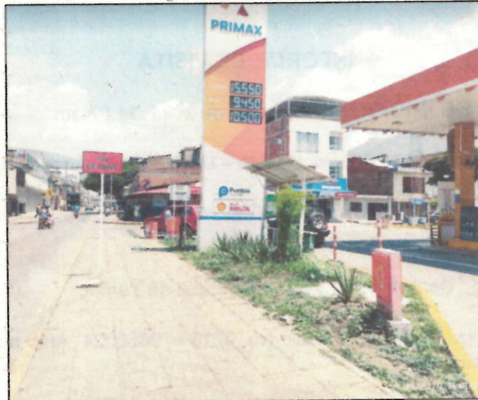
Foto 2. Ubicación de dirección referenciada

Corporación Autónoma Regional del Valle del Cauca