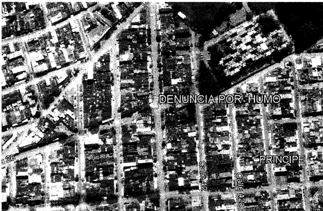
Imagen 1.

Corporación Autónoma Regional del Valle del Cauca