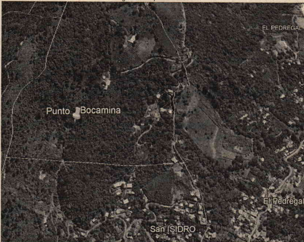
Imagen donde se muestran la ubicación de los puntos según coordenadas de los oficios, fuente Google Earth

Corporación Autónoma Regional del Valle del Cauca