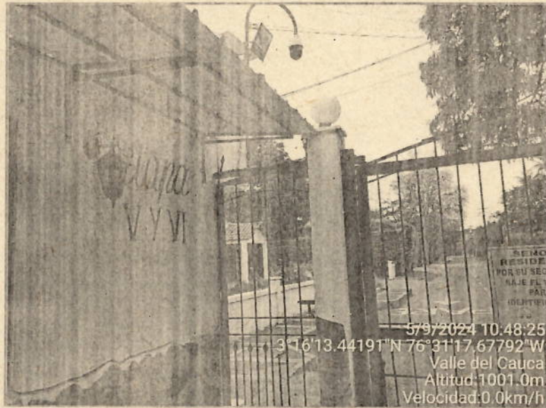
Foto 2. Evidencia de la visita a Solares de la Morada, Etapas V y VI

Corporación Autónoma Regional del Valle del Cauca