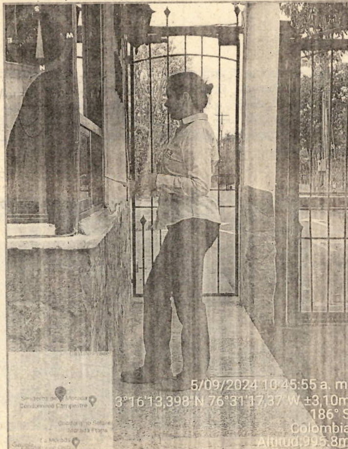
Foto 1. Evidencia de la visita a Solares de la Morada, Etapas V y VI