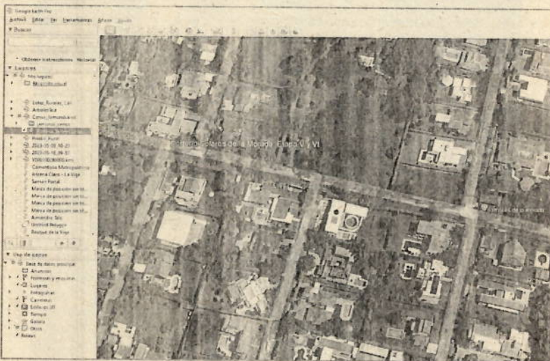
Imagen 1. Condominio solares de la Morada etapa 5 y 6

Realizar entrega de correspondencia al señor Reinaldo Zapata en el predio casa 5, Manzana E del condominio Solares de La Morada, Etapa V y VI, en relación con lo siguiente: "De acuerdo con lo dispuesto en el artículo primero (2) del acto administrativo 27 de agosto de 2024, le comunicamos del AUTO POR MEDIO DEL CUAL SE DECRETA LA PRACTICA DE PRUEBAS, del expediente con No.0713-039-003-065-2020 por lo cual se remite copia del acto administrativo para su conocimiento."