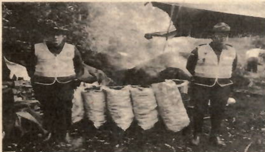
Fotografía 2: Lugar decomiso.

El material decomisado; se dejó en custodia en las instalaciones auxiliares de la CVC; ubicados en la carrera 53 #13A-50, del barrio primero de mayo, del municipio de Santiago de Cali, del departamento Valle del Cauca.