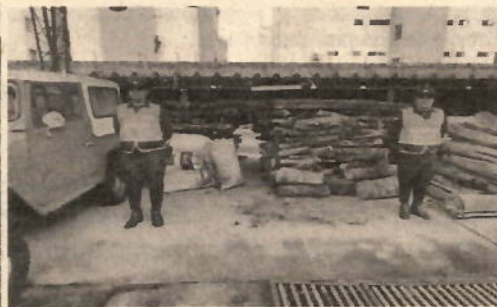
Fotografía 3: Disposición de decomiso.