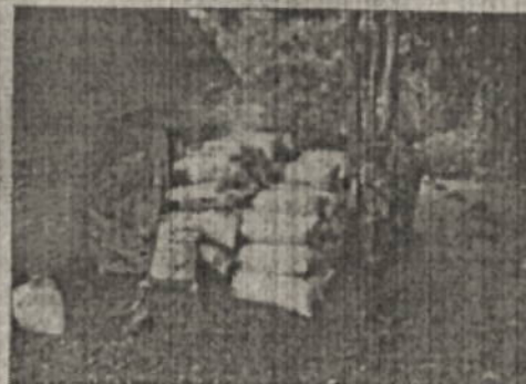
IMÁGENES DEL CARBÓN DEJADO A DISPOSICIÓN DE LA CVC EN LAS INSTALACIONES DEL CENTRO DE ATENCIÓN Y VALORACIÓN DE FAUNA SILVESTRE DE LA CVC EN SAN EMIGDIO - PALMIRA.