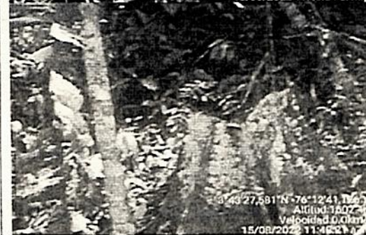
Árboles erradicados ubicados sobre la zona protectora de una corriente de agua afluente de la quebrada Paporrinas.

Otra situación evidenciada en la visita es la intervención sobre un bosque natural secundario que hace parte de la zona amortiguadora de la microcuenca Paporrinas en un área de 5000 metros cuadrados, donde se intervinieron especies como Guamo, Tachuelo, Manzanillos, Laureles, Niquitos, Balsos, área que hacia parte de una zona antigua de cafetal y que por topografía y ubicación se había dejado en regeneración natural con el fin de aumentar cobertura de una corriente de agua que abastece al predio El Topacio y los sobrantes drenan aguas abajo a la corriente de agua denominada Quebrada Paporrinas.