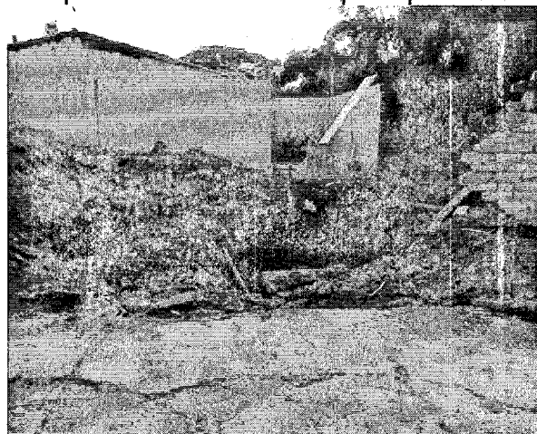
Ilustración 6. ÁRBOL ARRANCADO DE RAÍZ EN PREDIO K62. DANIEL H. CVC 2024.