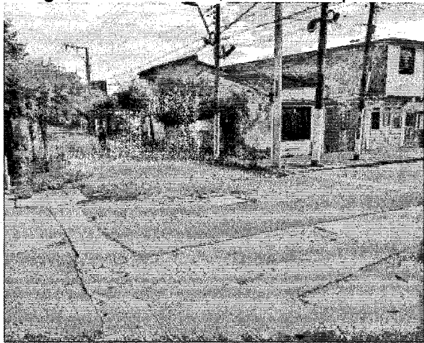
Ilustración 3. ESQUINA DE LA CALLE 12 CON CARRERA 62 LADO SUR SIN INTERVENCIONES. DANIEL H. CVC 2024.

El día 24 de junio de 2024, funcionarios adscritos Dirección Ambiental Regional Norte de la CVC, realizaron visita para atender denuncia ambiental por corte de árbol, en el momento de la visita se observa en el sitio descrito por la denuncia carrera 62 con calle 12 esquina donde describen que están talando un árbol de más de 20 años, que no hay intervenciones de árboles en el sitio, se hace recorrido por las 4 esquinas y se determina que no hay intervenciones en la dirección descrita, se hace desplazamiento a un predio urbano en Zaragoza calle 13 con carrera 62, Cartago, Valle del Cauca, donde hubo poda severa de un árbol con las siguientes características: