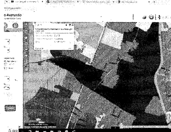
Ilustración 2. CARACTERÍSTICAS DEL SECTOR DE LA INTERVENCIÓN. GEO CVC. CVC 2024.