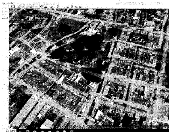
Ilustración 1. LOCALIZACIÓN ÁRBOL DE GUASIMO OBJETO DE PODA SEVERA.

Terreno de Predio Urbano IGAC: 761470104000000230020000000000