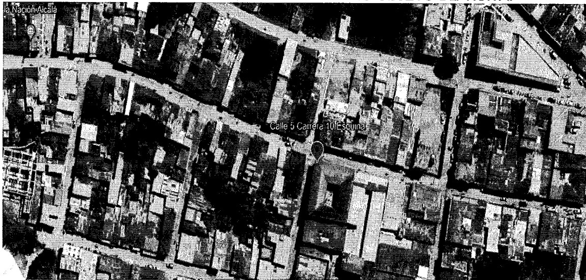
Ilustración 1. LOCALIZACIÓN PREDIO OBJETO DE VISITA.

Coordenadas geográficas: Latitud: 4°40'29"N Longitud 75°47'00"O Altitud 1.230 msnm.