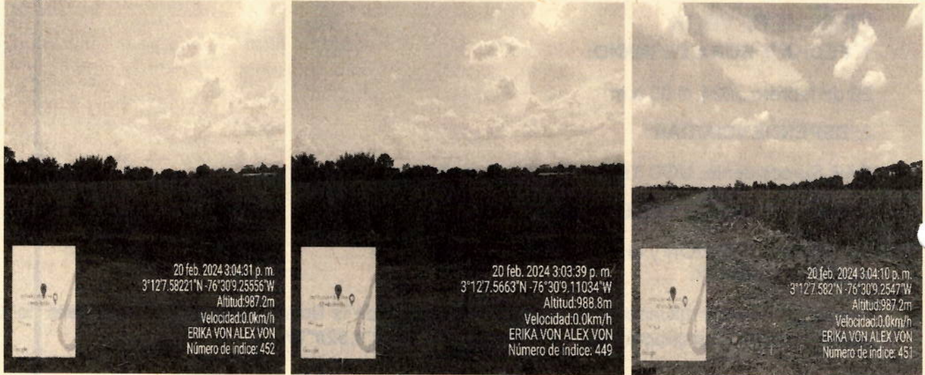
Imagen 2.3.4 Ubicación del lote

establecer comunicación con el señor y la señora antes mencionados, personalmente se deja registro fotográfico como evidencia de la visita.