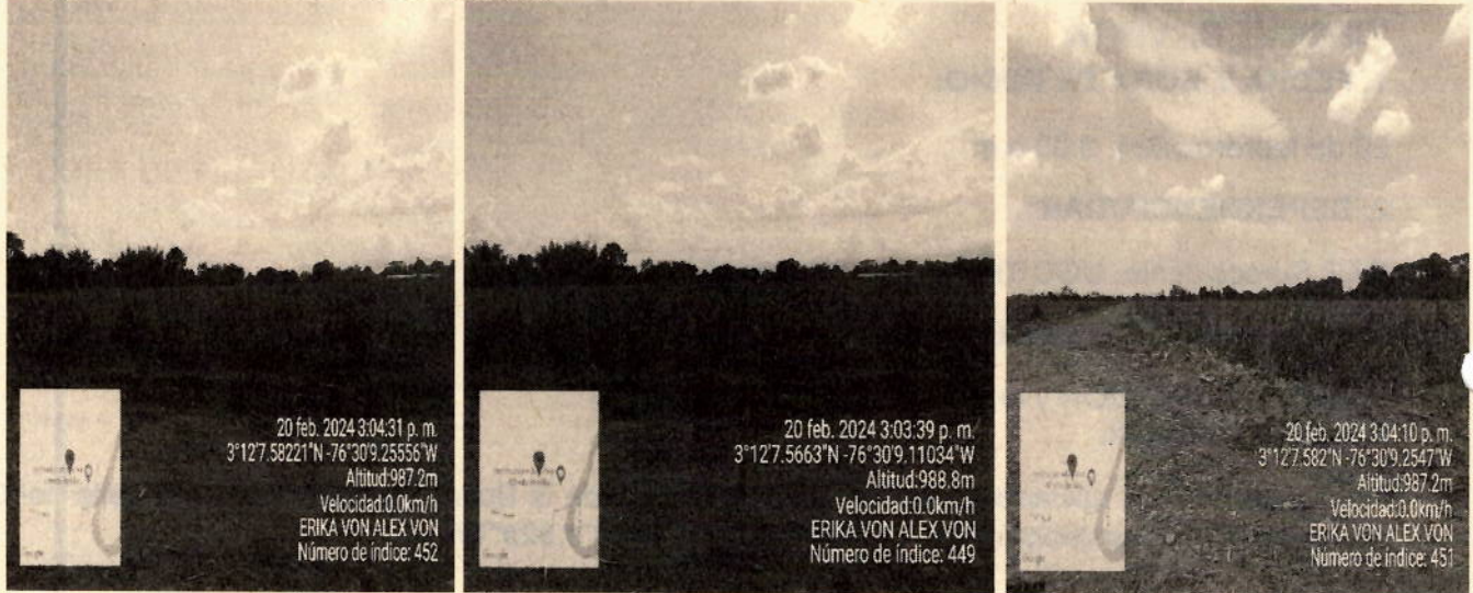
Imagen 2.3.4 Ubicación del lote

establecer comunicación con el señor y la señora antes mencionados, personalmente se deja registro fotográfico como evidencia de la visita.