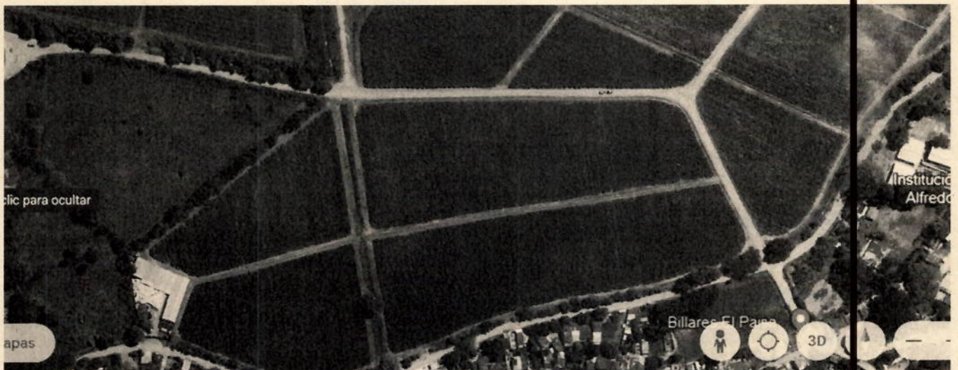
Imagen 1. Ubicación del lote

Predio sin nombre ubicado en el Corregimiento Paso de la Bolsa Municipio Jamundí valle del Cauca, en las coordenadas geográficas: 76°30'9,878"N 3°12'9,529"W