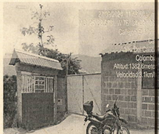
Fotografía 1: Ubicación predio SN