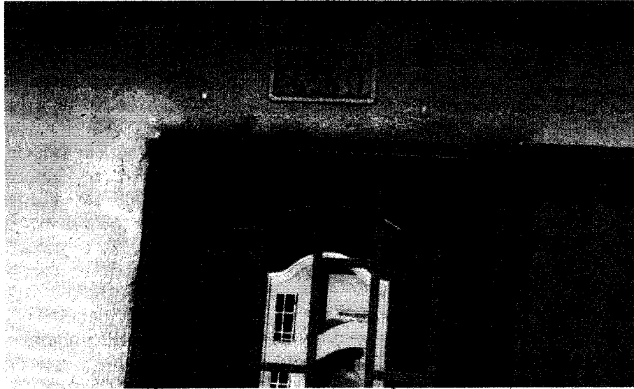
Foto. Predio ubicado en el callejón Guayabal, no se pudo ubicar el sitio de la denuncia.