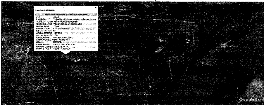
Ilustración N°1: ubicación del predio "Graminea"

Corporación Autónoma Regional del Valle del Cauca