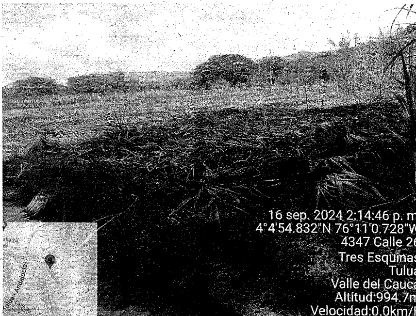
Registro fotográfico, Incendios Forestal predio El recuerdo, sector San Benito del municipio de Tuluá.