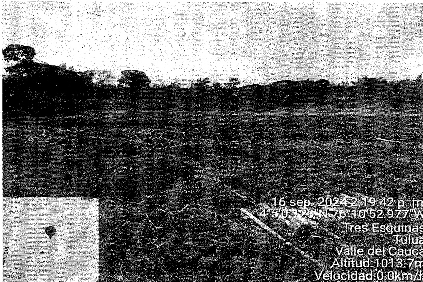
Registro fotográfico, Incendios Forestal predio El recuerdo, sector San Benito del municipio de Tuluá.

Corporación Autónoma Regional del Valle del Cauca