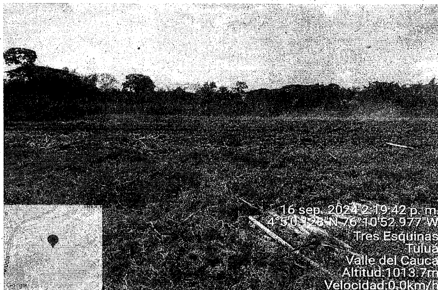
Registro fotográfico, Incendios Forestal predio El recuerdo, sector San Benito del municipio de Tuluá.

Corporación Autónoma Regional del Valle del Cauca