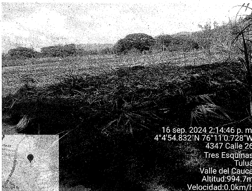
Registro fotográfico, Incendios Forestal predio El recuerdo, sector San Benito del municipio de Tuluá.