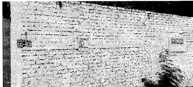
Ilustración 1 Ubicación del predio según nomenclatura

Predio urbano identificado con nomenclatura Calle 41 N° 1g-03, barrio Luis Carlos Galán jurisdicción territorial del municipio de Cartago