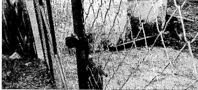
Ilustración 2 Evidencia de que el predio se encuentra cerrado y no se puede hacer la visita dentro del predio

Corporación Autónoma Regional del Valle del Cauca