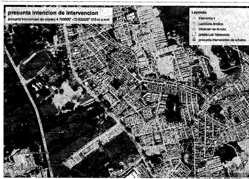
Ilustración 1 Ubicación del predio