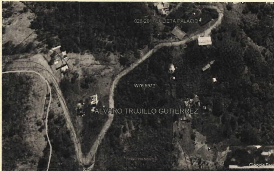
Fotografía 1: Ubicación predio SN, fuente: Google Earth 2024.