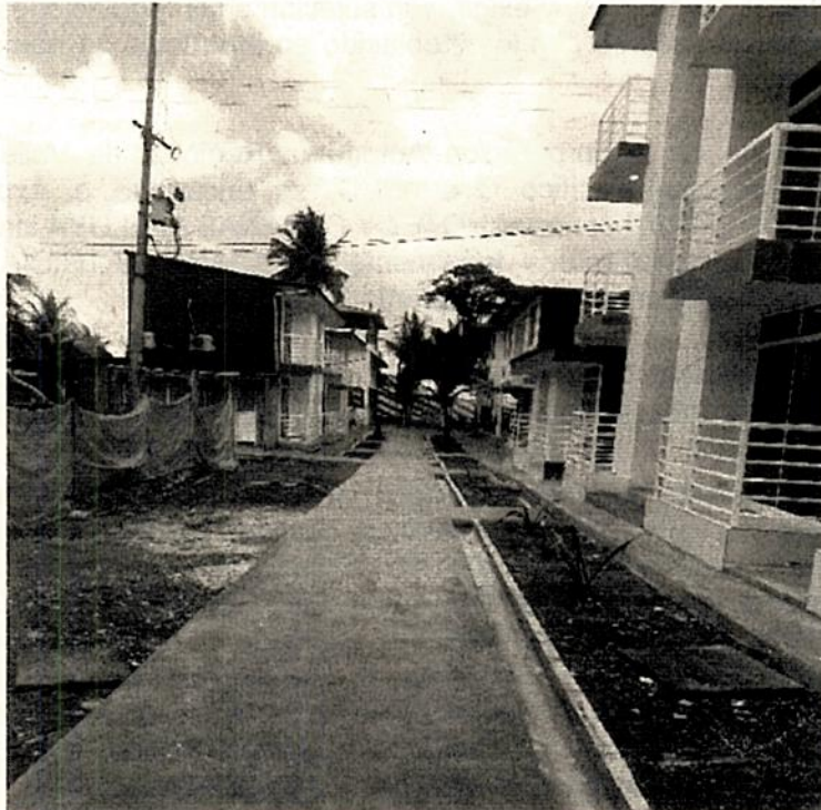
Foto No. 1 panorámica general del establecimiento turístico.

De acuerdo con lo anterior, el Coordinador de la Unidad de Gestión de Cuenca, de la Dirección ambiental Regional del pacífico Oeste, de la Corporación Autónoma Regional del Valle del Cauca, CVC, remite a la oficina de apoyo Jurídico de la DARPO, el concepto técnico realizado por los funcionarios de la UGC – 1082.