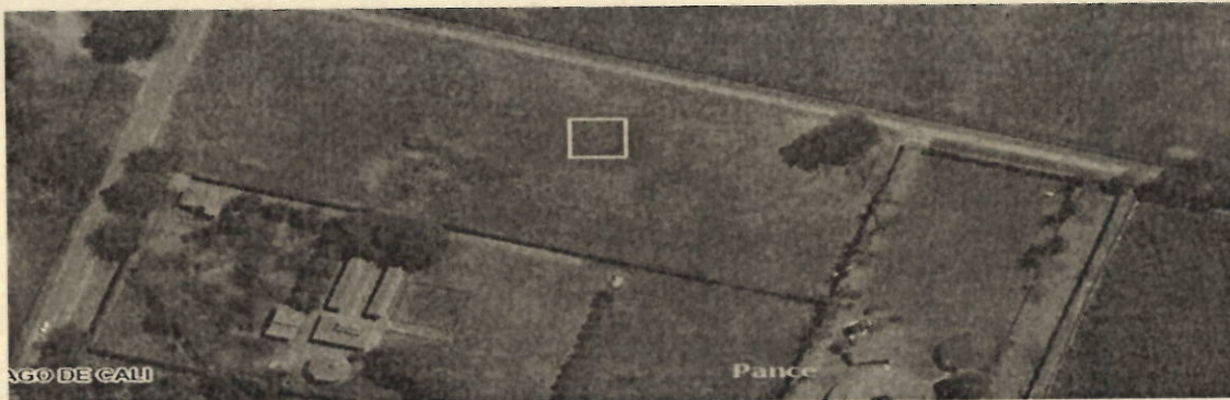
Imagen 1. Ubicación del lote sobre las coordenadas geográficas 76^{\circ}32'27,30'' O 3^{\circ}18'03,23'' N

Predio ubicado en el corregimiento de Pance, con proyección Avenida Cañasagordas. en las coordenadas geográficas: 76^{\circ}32'27,30'' O 3^{\circ}18'03,23'' N