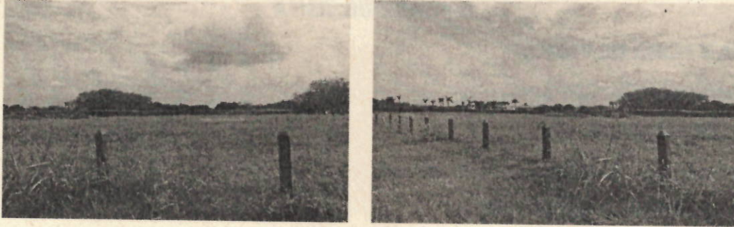
Imagen 1.2. Ubicación del lote.

Corporación Autónoma Regional del Valle del Cauca