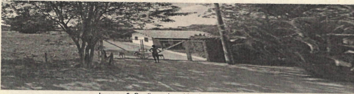
Imagen 3. Predio vecino ubicado al lado del Lote.