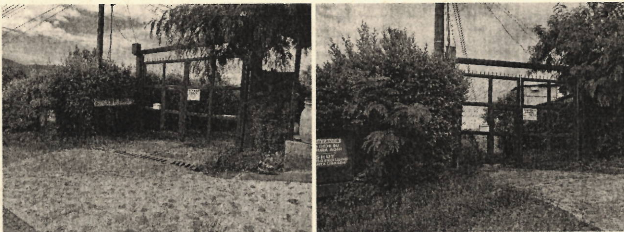
Fotos N° 1 y 2. Sitio de la portada de ingreso al predio del señor Cuervo