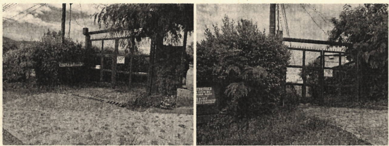
Fotos N° 1 y 2. Sitio de la portada de ingreso al predio del señor Cuervo