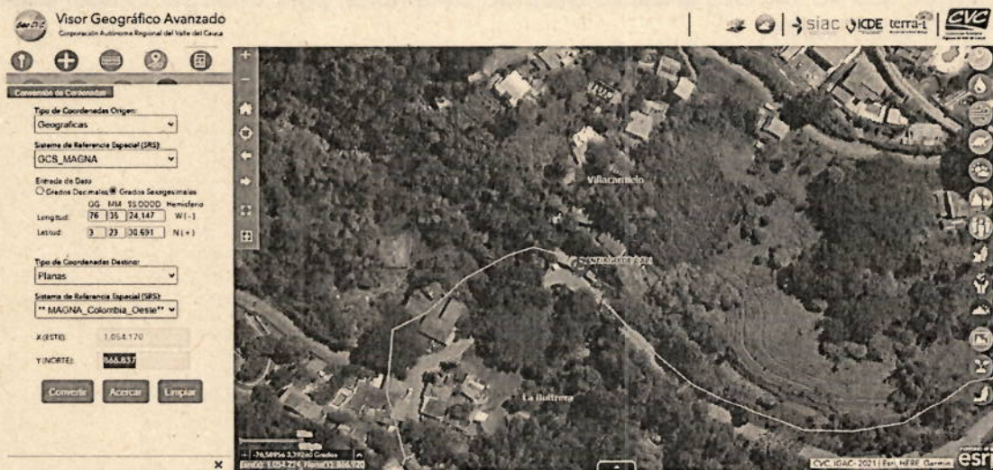
Mapa 1. Ubicación geográfica de la visita realizada. Fuente GeoCVC

Jurisdicción del Distrito de Cali, corregimiento de Villacarmelo, Vereda La Fonda, Inmediaciones de las coordenadas geográficas 3^{\circ}23'30,691'' N -76^{\circ}35'24,147'' y Planas X=1054170 E Y= 866837 N