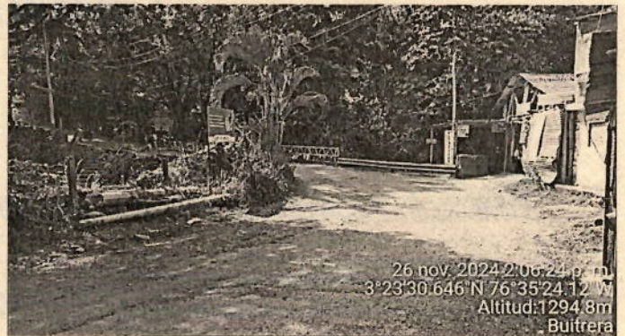
Foto 1. Lugar de entrega de notificación.