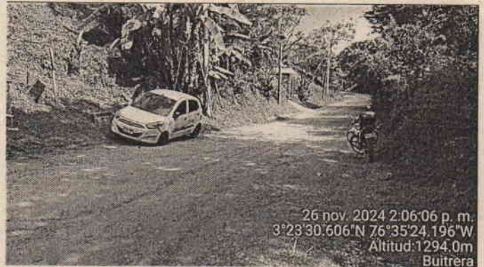
Foto 1. Zona recorrida para entrega de notificación.