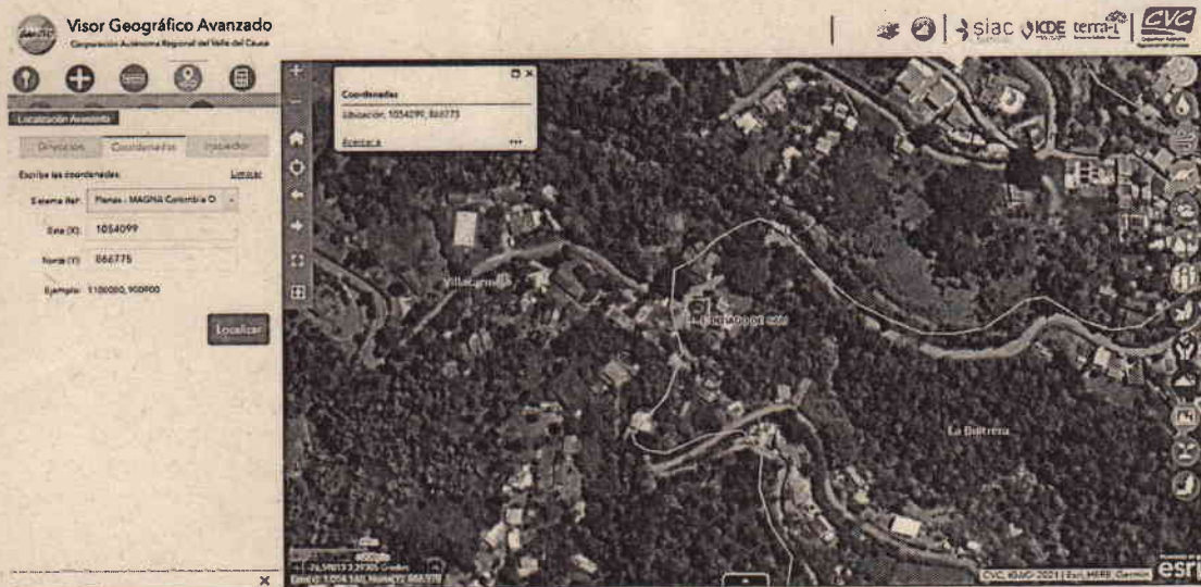
Mapa 1. Ubicación geográfica de la visita realizada.

Jurisdicción del Distrito de Cali, corregimiento de La Buitrera, Vereda La Fonda, Inmediaciones de las coordenadas geográficas 3^{\circ}23'28,668'' N -76^{\circ}35'26,473'' y Planas X=1054099 E Y=866775 N