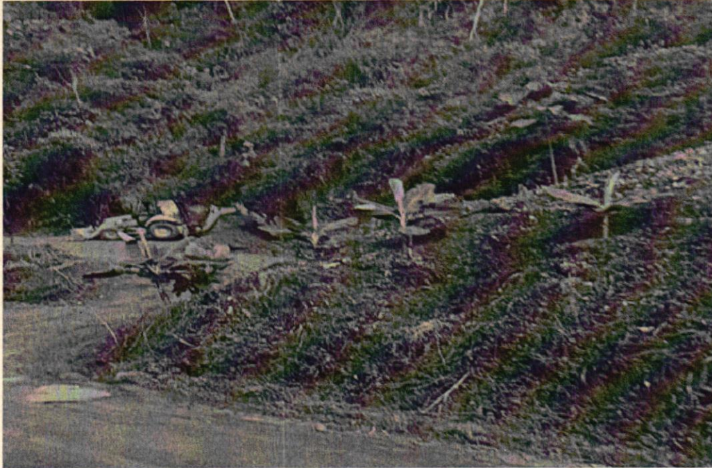
Foto 1. Máquina en proceso de remoción del material.

Citar este número al responder: 0782-1087792024