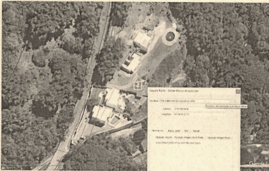
Fotografía 1: Ubicación predio, fuente: Google Earth 2024.

Se realiza visita técnica al predio que se ubica en inmediaciones de las coordenadas geográficas: N: 3°25'50.687", O: 76°33'33.257". del sistema de referencia Magna_sirgas WGS 84.