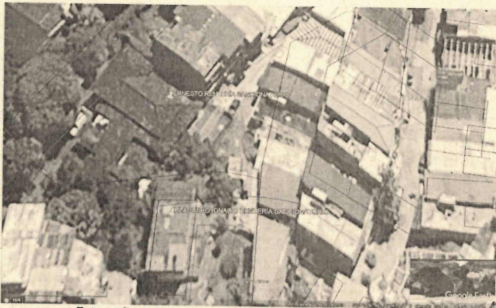
Fotografía 1: Ubicación predio.

Se realiza visita técnica al predio que se ubica en inmediaciones de las coordenadas geográficas: N: 3°24'21.330", W: 76°34'41.520". del sistema de referencia Magna_sirgas WGS 84.