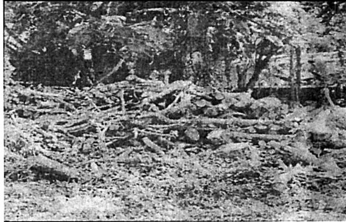
Figura 1. Trozas de pomarrosa, mandarino y chiminango equivalente a 7.287m 3 .

( Sysigium malacaense ), 0.7m 3 de Mandarino ( Citrus reticuala ) y 0.087m 3 de Chiminango ( Pithecellobium dulce ) en regular estado fitosanitario.