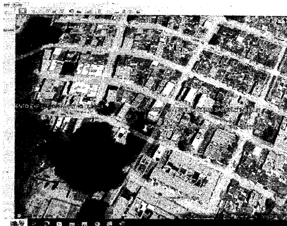
Ilustración 2. LOCALIZACIÓN DEL ÁRBOL SAMÁN OBJETO DE VISITA. GOOGLE EARTH CVC 2024