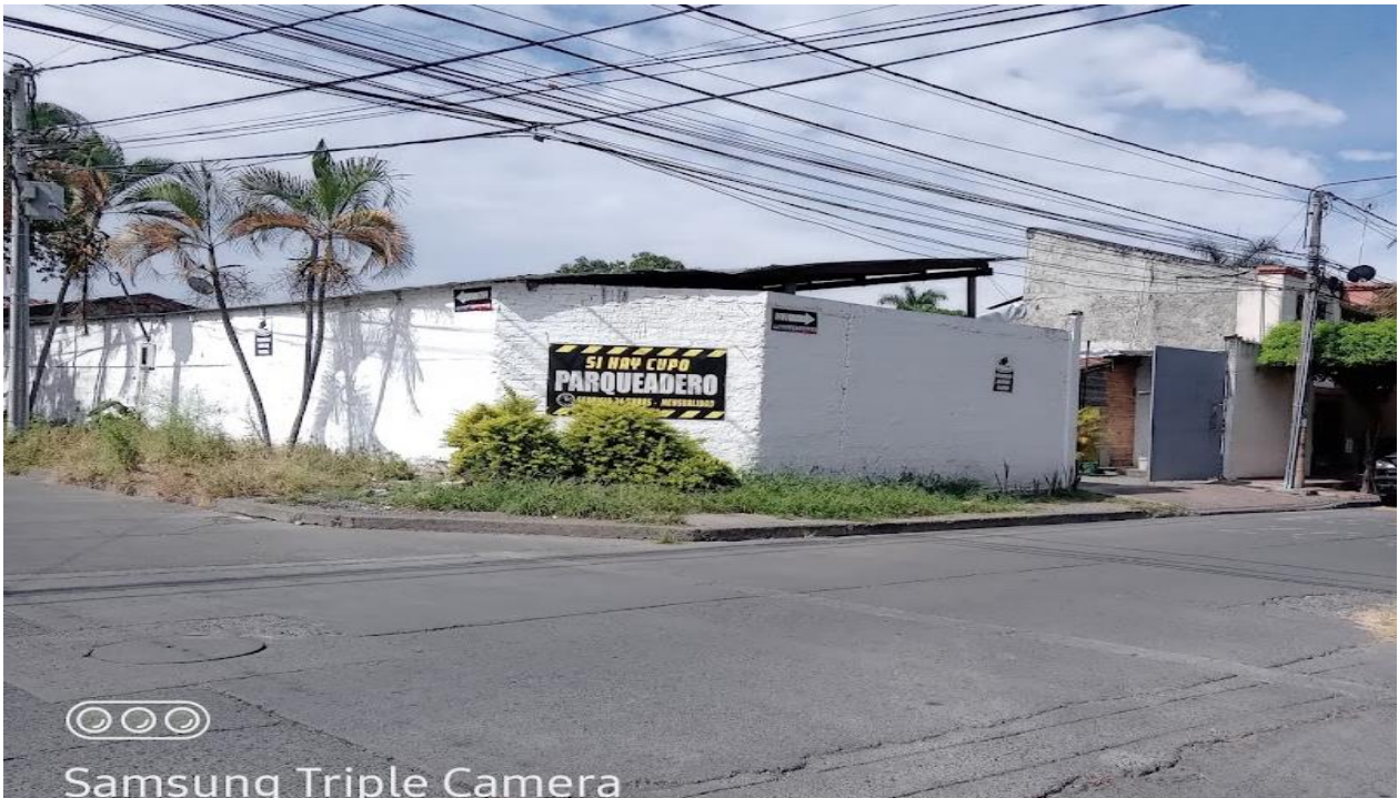
Samsung Triple Camera Foto No. 6. Fachada del predio.