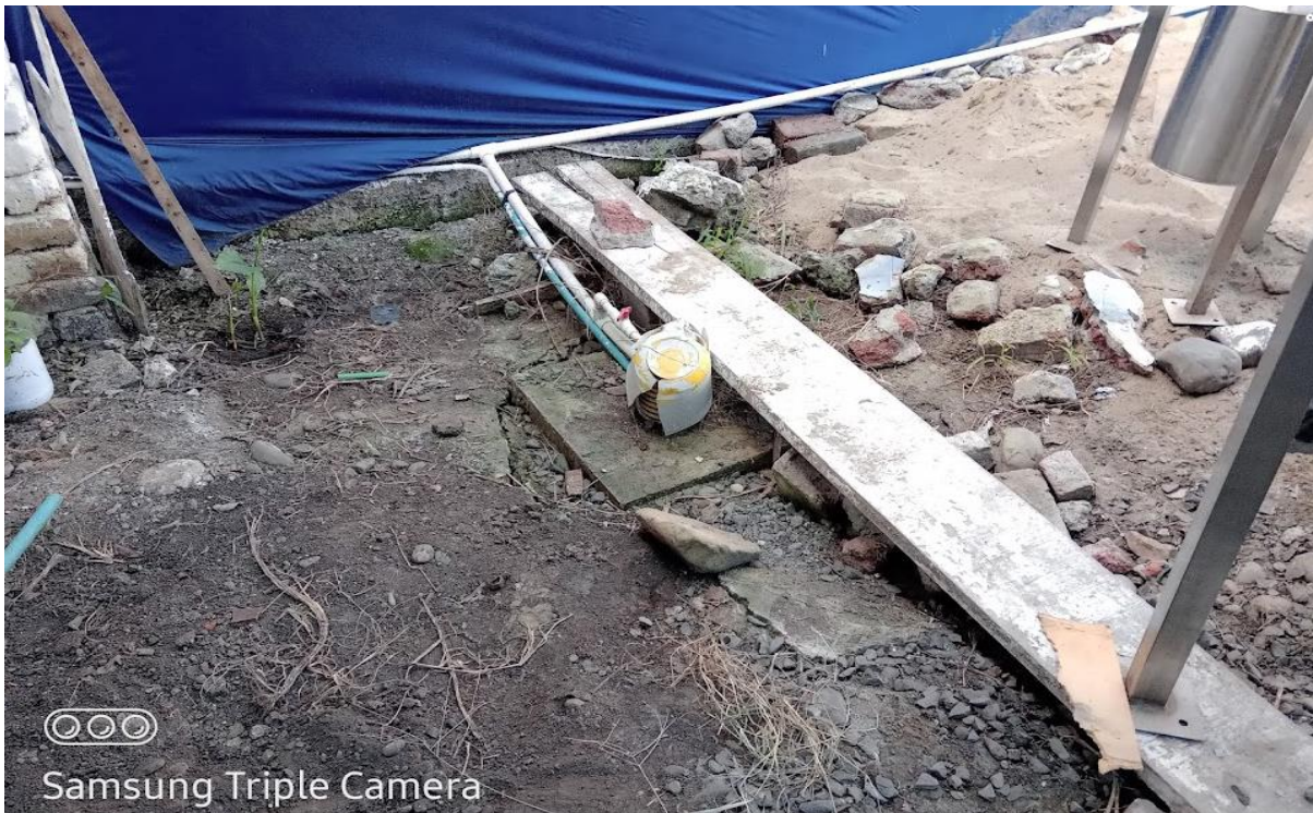
Foto No. 2. Ubicación del aljibe a ras de suelo, con instalación eléctrica y tubería de conducción.