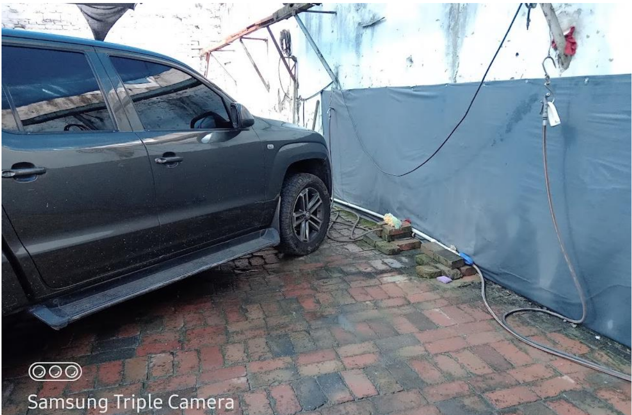
Foto No. 4. Final de la tubería que provienen del aljibe y termina en una manguera.