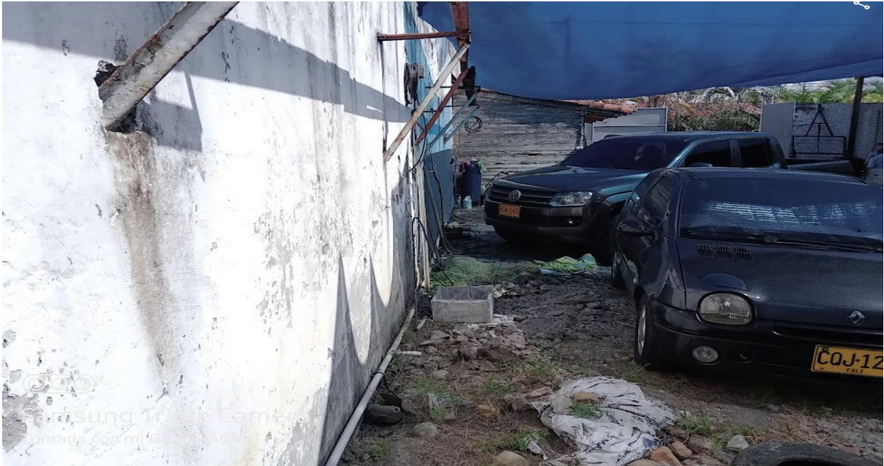
Foto No. 3. Instalaciones y tubería que provienen del aljibe.