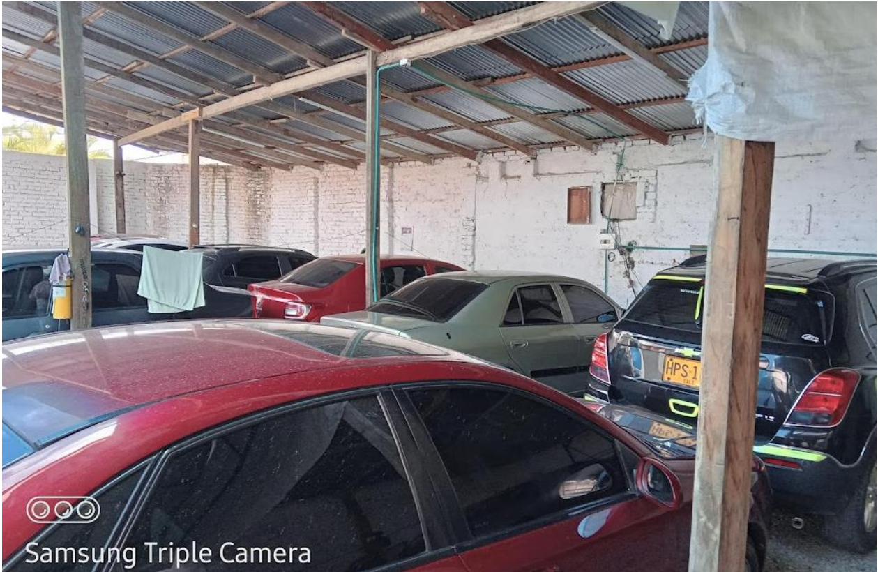
Samsung Triple Camera Foto No. 5. 10 vehículos parqueados.