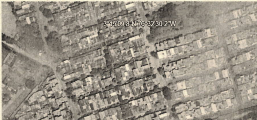
Figura 1. Localización del predio.