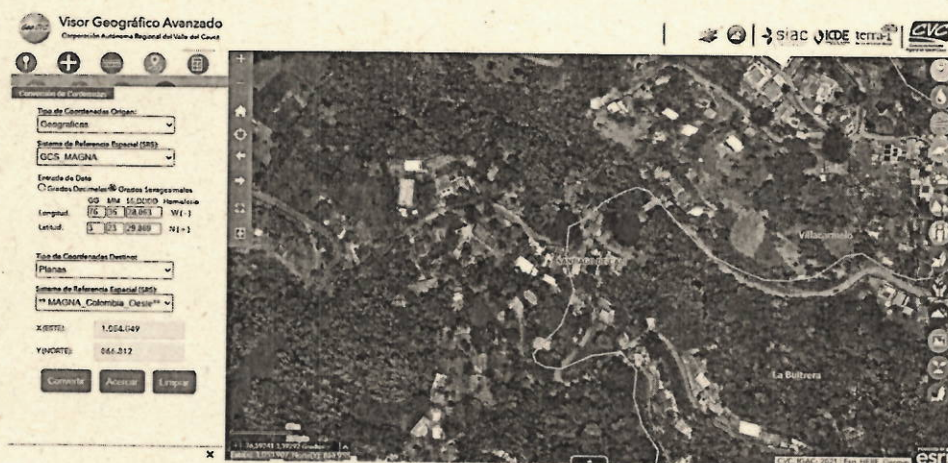
Mapa 1. Ubicación geográfica de la visita realizada.

Jurisdicción del Distrito de Cali, límites de los corregimientos de La Buitrera y Villacarmelo, Vereda La Fonda, Inmediaciones de las coordenadas geográficas 3°23'29,869" N -76°35'28,063" OE y Planas X=1054049 E Y=866812 N