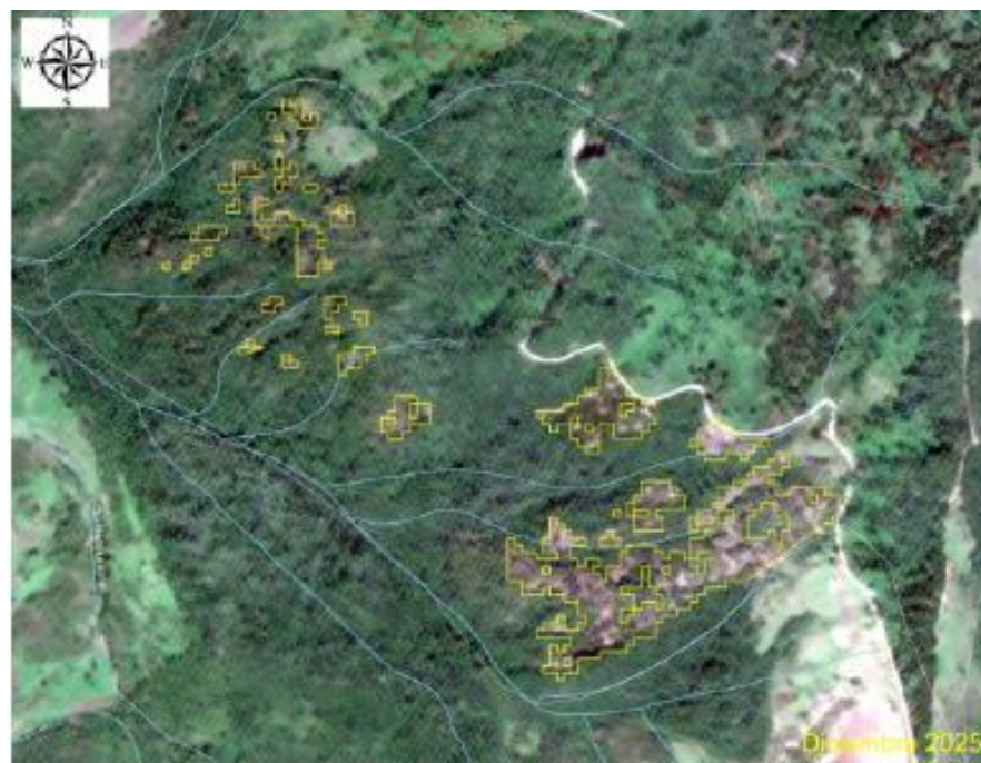
Figura 1. Comparativo de imágenes satelitales Sentinel-2 agosto de 2024 y diciembre 2025 del área de detección de la alerta 05_00_3025 cuenca Bugalagrande, municipio de Tuluá. Los polígonos en color rojo representan alertas previamente publicadas en el reporte 17 de 2024, los polígonos en color amarillo corresponden a las nuevas áreas identificadas.