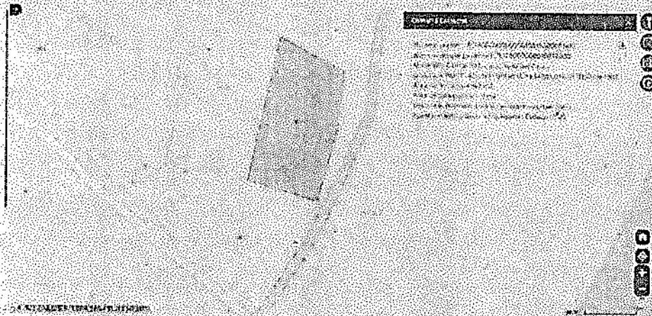
Imagen 2: Ubicación del Lote 11 de la Parcelación Florencia etapa 2 en el visor catastral.

"POR LA CUAL SE IMPONE UNA MEDIDA DE PREVENTIVA DE SUSPENSIÓN DE ACTIVIDADES Y SE INICIA UN PROCEDIMIENTO SANCIONATORIO AMBIENTAL."