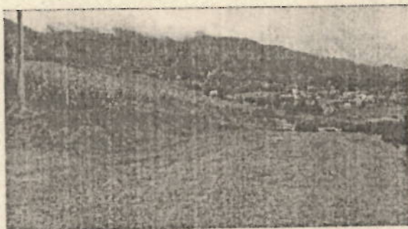
Foto 5: Área de terreno explanada – Lote 11 Parcelación Florencia Epata 2.

Foto 4: Visual de la vía interna desde el lote 11.