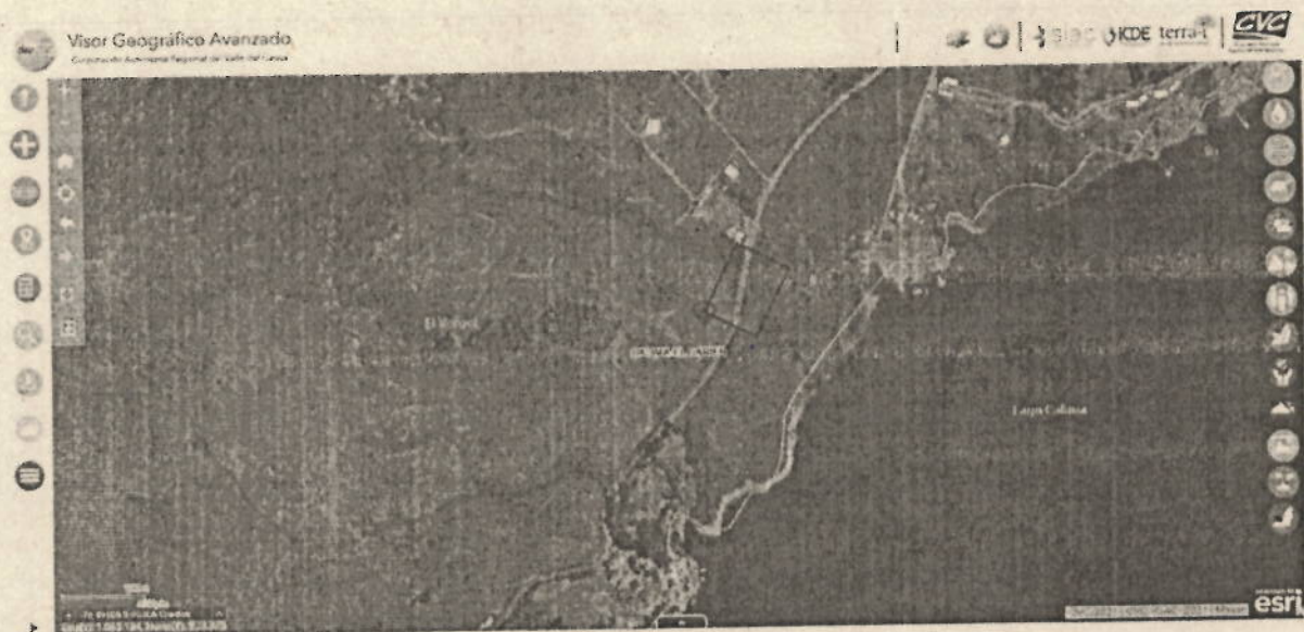
Imagen 1: Ubicación del Lote 11 de la Parcelación Florencia Etapa 2.