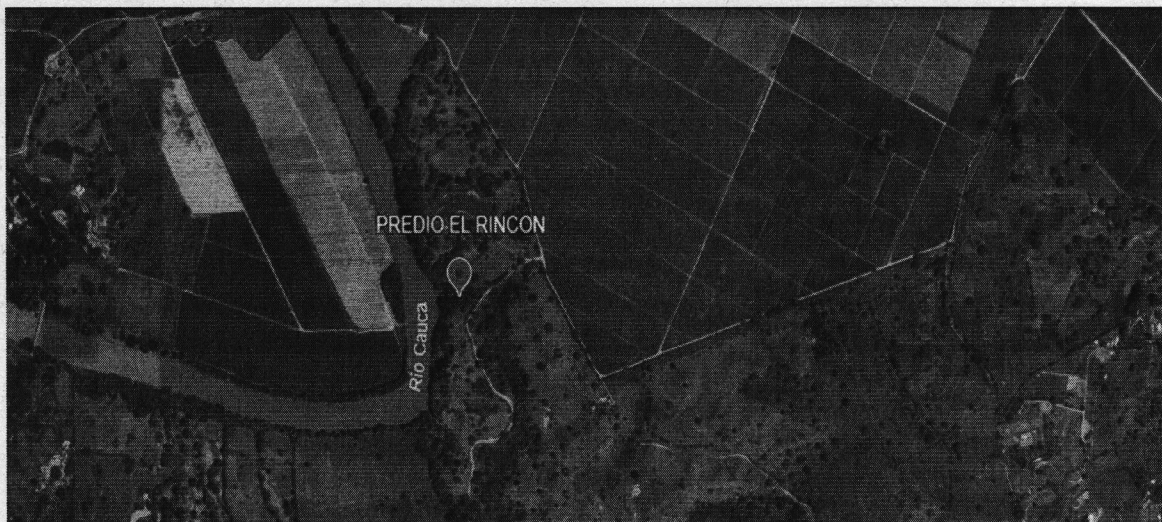
Ilustración No. 1. Predio El Rincón. Cartago. GEO CVC 2026.

Coordenadas Latitud: 4°47'03.95"N 75°57'10.74"W Altitud 903.56 msnm.