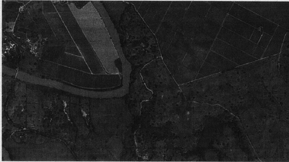
Imagen satelital del 15 de marzo de 2026.

Corporación Autónoma Regional del Valle del Cauca