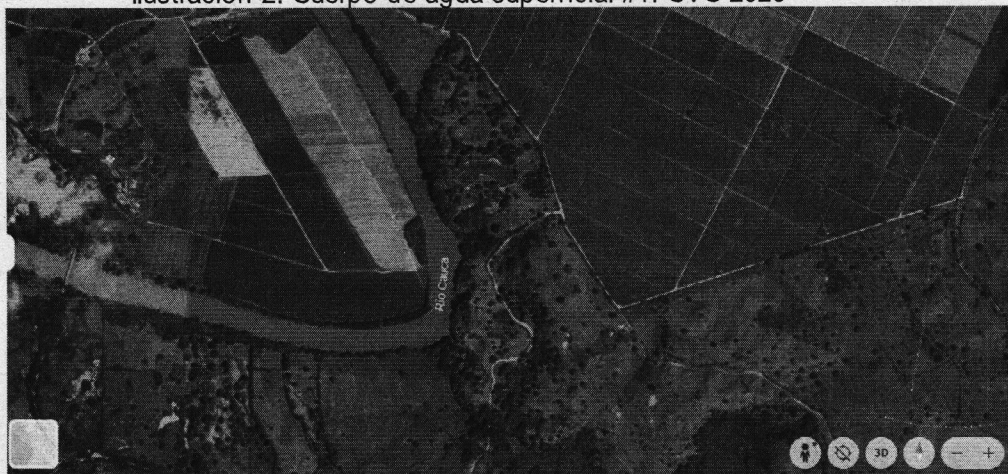
Imagen satelital del 10 de febrero de 2024.